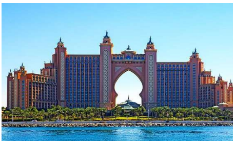
Atlantis The Palm