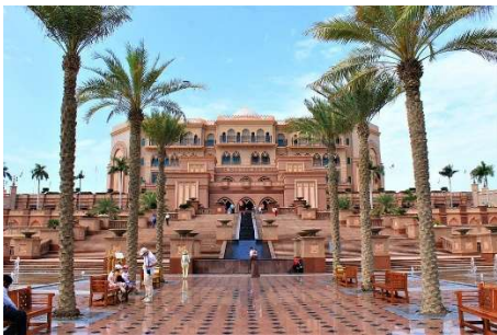
Präsidentenpalast, Abu Dhabi