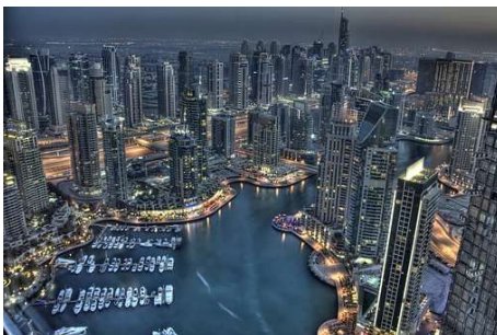
Dubai Marina by night