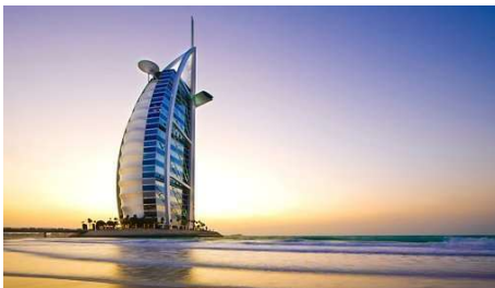
Burj Al Arab