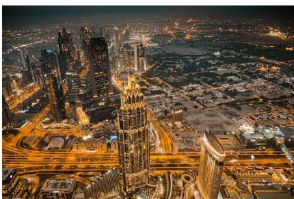
Burj Khalifa / Dubai