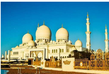
Sheikh Zayed Moschee, Abu Dhabi

Ein Taxi vom Expo Gelände zurück zum Hotel (25 min Fahrzeit) kostet ca. 10 Euro. Das Mittagessen an den beiden EXPO Tagen wurde bewusst offen gelassen um die zahlreichen Angebote individuell erkunden zu können.