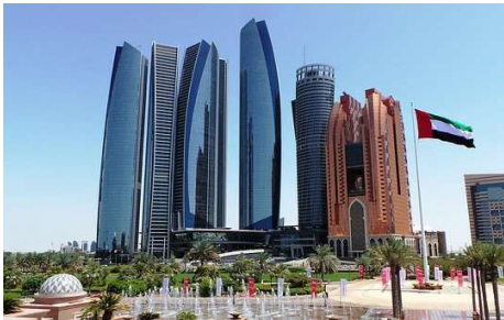
Etihad Towers, Abu Dhabi