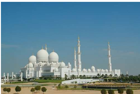
Sheikh Zayed Moschee, Abu Dhabi